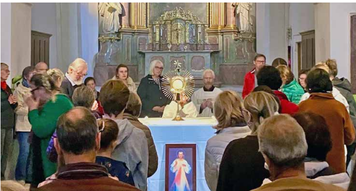
Abend der Barmherzigkeit