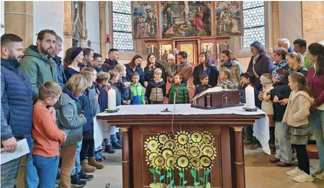
Vorstellgottesdienst der EK-Kinder in St. Johann