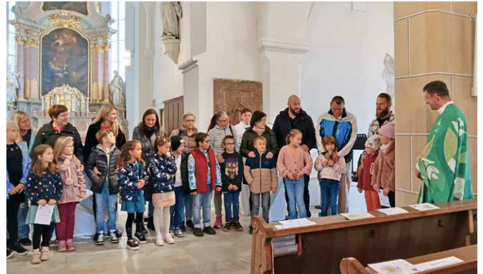
Vorstellgottesdienst der EK-Kinder in Wolfsberg