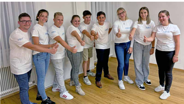
Jugendpfarrgemeinderat der Stadtpfarre Wolfsberg