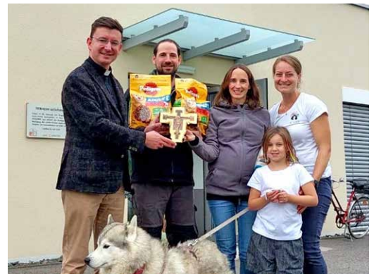
Franziskuskreuz für Tierheim