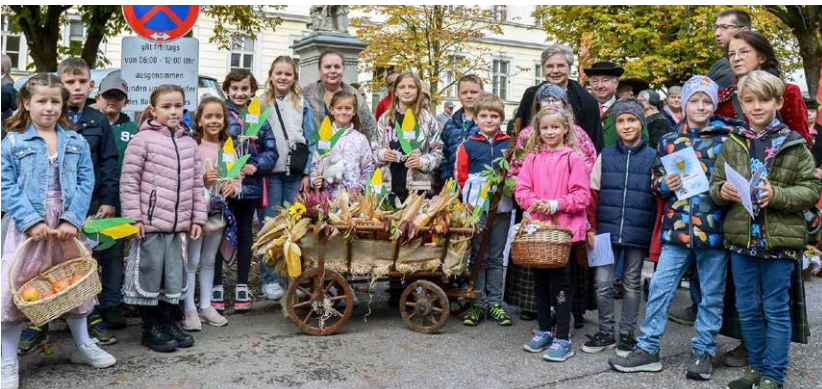
Erntedankfest in Wolfsberg