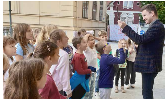
Kirchenrallye der EK-Kinder in der Markuskirche